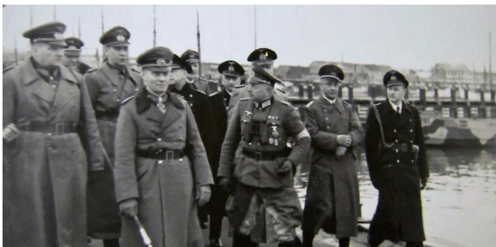
Foto: Rommel med følge ved Esbjerg Havn.