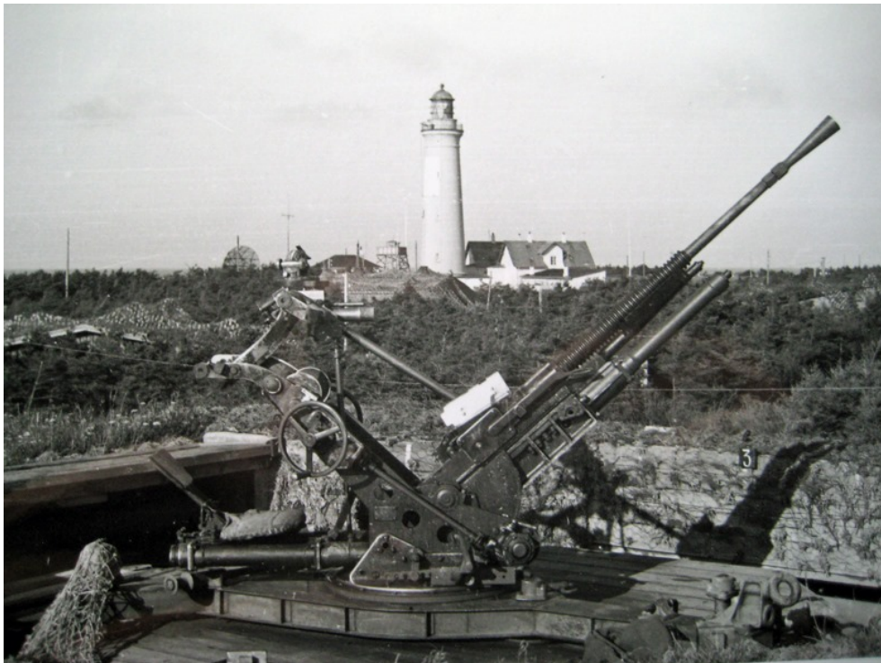
Foto: Samtidigt foto fra Tonny Jensens samling. I baggrunden, til venstre for fyrtårnet, anses toppen af 'Würzburg Riese' radaren.

KOMMENTAR: Af og til lavede man afvigelse fra Regelbau systemet for at imødekomme lokale terrænforhold. I 10. Bateria blev indgangen til skytsbunkerne [Regelbau 671] således overdækket, så kanonerne kunne bemandedes uden mandskabet kom under ild. Betonkuppen på fotoet herover er denne indgang.