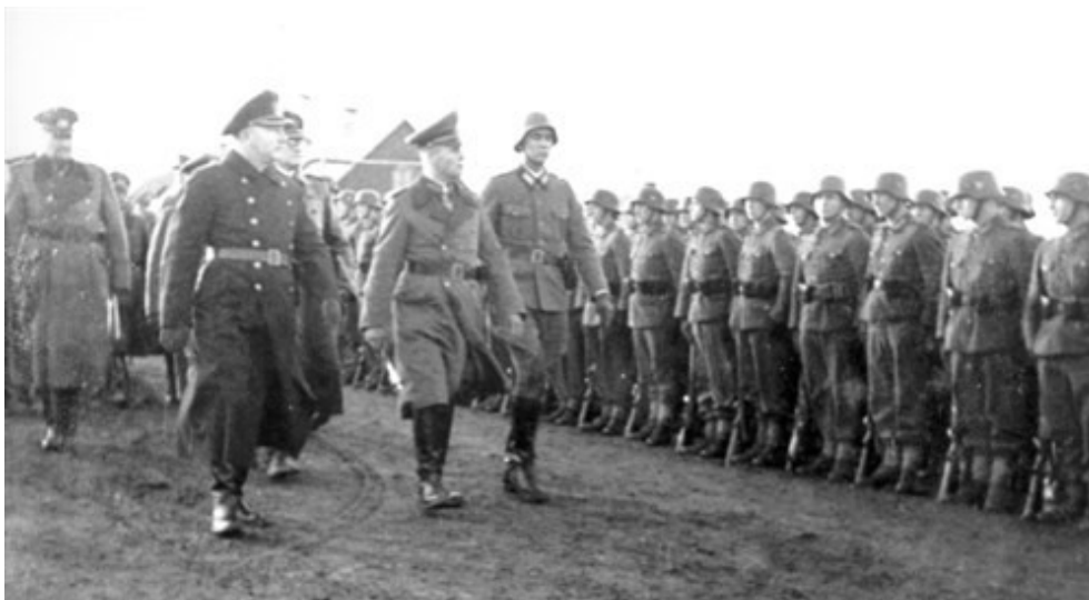
Foto: Feltmarskalken inspicerer tropperne ved Hanstholm.

HANSTHOLM I DAG: 400+ bunkere og betonkonstruktioner gjorde Hanstholm til Nordeuropas stærkest befæstede område og rigtig meget er bevaret i dag. Bunkermuseet har til huse i en af de store Regelbau S75 bunkere [link] , som er fuldstændigt renoveret og fremtræder som dengang, komplet med 38 cm granater i magasinet. Kun kanonen mangler, og den må du til Kristiansand for at se [link] . Derudover bør du ikke snyde dig selv for at se nogle af de 'vilde' bunkere i området, men husk; nogle af dem er meget store. Husk lommelygte (og reserve) – og udvis forsigtighed!