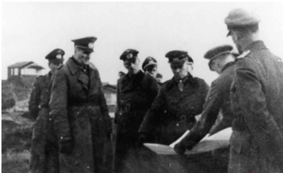
Foto: Konference 'on location' med sø- og landmilitære eksperter.