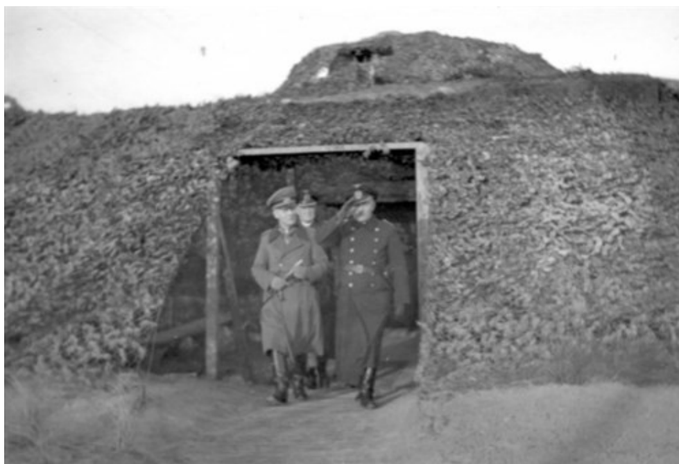
Rommel forlader en camoufleret bunker, angiveligt et eller andet sted langs Vestkysten.

Der findes steder i Atlantvolden, der er velkendte, ja ligefrem berømte, såsom invasionsstrandene i Normandiet; det kraterarrede landskab ved Pointe du Hoc eller de store batterier ved Pas-de-Calais, hvis kanoner kunne skyde over Kanalen og ramme England, og man synes måske, at vore egne 'seværdigheder' ved den jyske vestkyst blegner i sammenligning, men faktisk hørte Danmark, med sine knap 7000 betonkonstruktioner, heraf godt 1700 egentlige bunkere, til blandt de stærkest befæstede strækninger i volden.