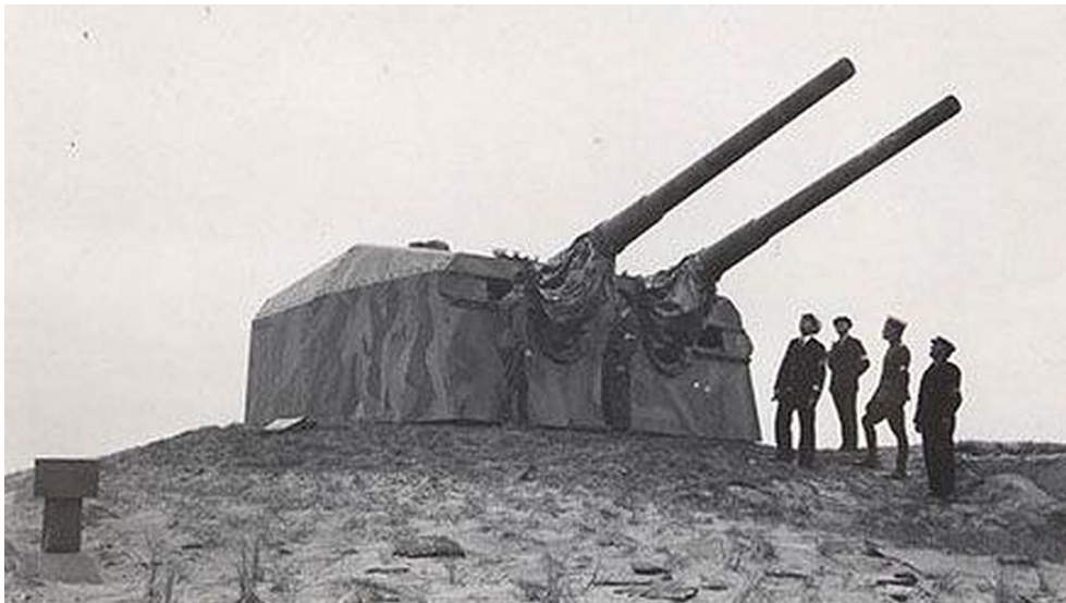
Foto: Med omkring 300 bunkere er Fanø et meget spændende sted at besøge. Af bunkeranlæg kan specielt fremhæves Marinebatteriet Graadyb, hvor pansertårnene fra slagskibet 'Gneisenau' var placeret. Fotoet er fra 1946, hvor en dansk kommission besøgte alle tyske installationer med henblik på, hvilke der kunne anvendes og hvilke, der skulle skrottes.

Rommel's ofte gentagne mantra om, at fjenden for enhver pris måtte standses på stranden.