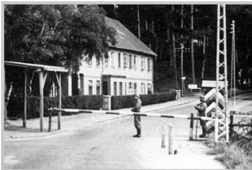
Indkørslen til Silkeborg Bad. Bortset fra bommen og soldaterne, så ser det såmænd næsten lige sådan ud i dag.

ROMMELS TUR STARTEDE I DANMARK , i december 1943. På grund af dårligt flyvevejr havde Rommel besluttet at køre med sit 'Befelszug' 3 til Danmark. Turen tog næsten to døgn [fra München] og han ankom til Kolding om aftenen den 2. december, hvorfra turen fortsatte med bil til Silkeborg Bad. Kurstedet havde siden foråret 1943 været det tyske, militære hovedkvarter i Danmark 4 under ledelse af General der Infanterie, Hermann von Hanneken. På samme tidspunkt ankom Rommel's flådespecialist, Vizeadmiral Friederich Ruge. På grund af det sene tidspunkt var der ingen drøftelser denne dag