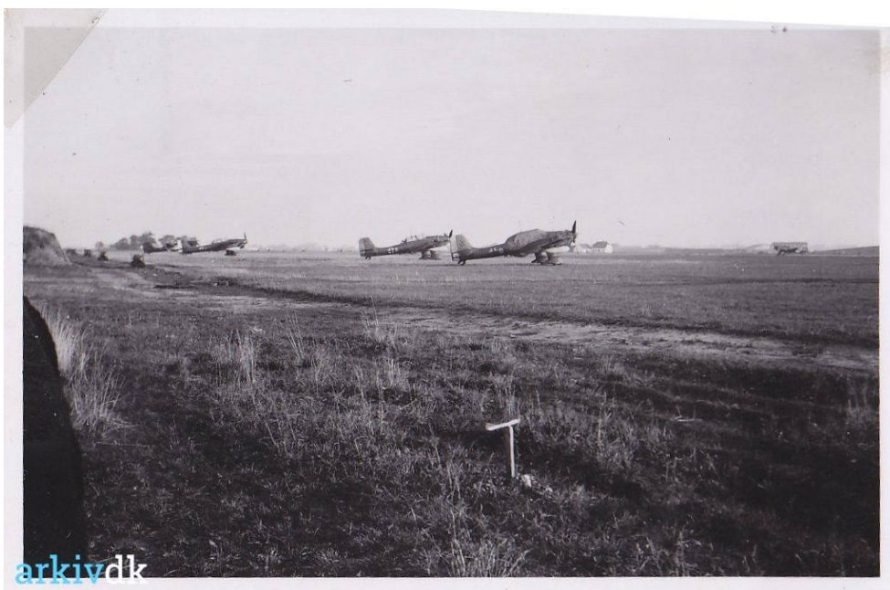
Foto: Aalborg Flyveplads. Der er ikke mange fly at se.