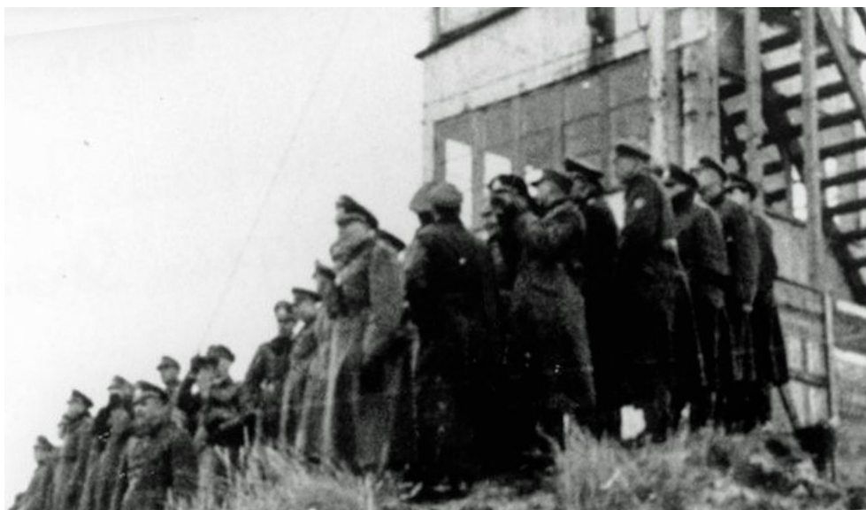
Foto: Rommel på Vejers Strand. Bemærk følgets størrelse; han har ikke været helt alene. Der vil naturligvis altid være et vist PR-element, når en berømt person som Rommel besøger 'fronten'. Dette blev jfr. optegnelserne klaret med '2. Advent Kaffee' med den stedlige stab.

DAGENE FRA DEN 5. TIL DEN 7. DECEMBER går med inspektioner af stillinger fra Esbjerg til Hanstholm; Nymindegab, Blaabjerg, Børsmose, Vejers Strand og Blaavandshuk. Rommel bemærker, hvor eksponerede de fremskudte artilleristillinger er for fjendeild, samt at infanteristillingerne, der skulle beskytte artilleriet ved fjendtlig landgang, befandt sig bag dette, frem for foran. Desuden nævner han manglen på svære våben i mange stillinger.